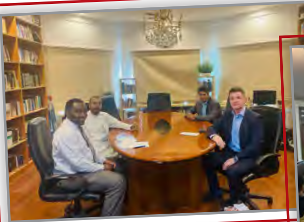
لقاء تعريفى بالإسلام