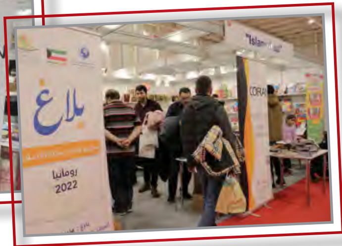
بلاغ - رومانيا