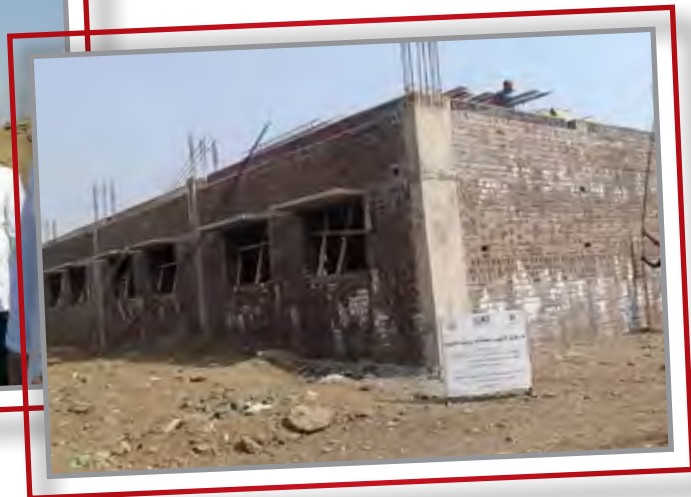
مراكز ودور الأيتام