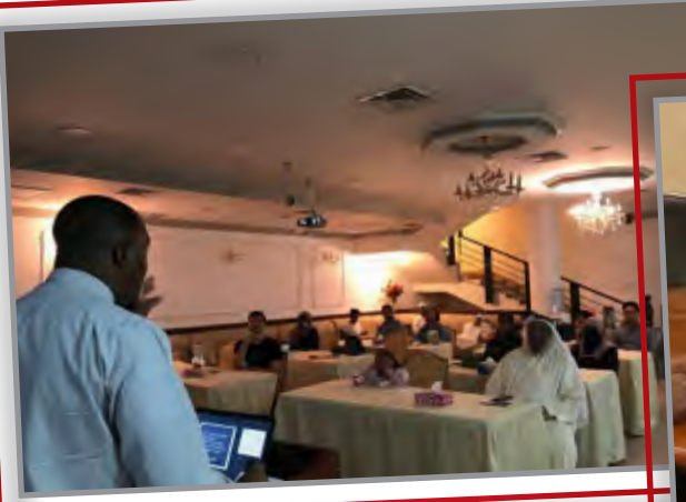
دروس قصص الأنبياء