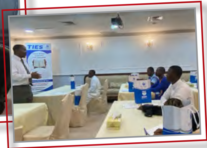
توزيع حقيبة الهداية