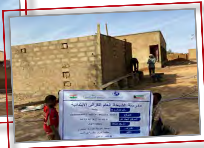
بناء مدرسة ابتدائية