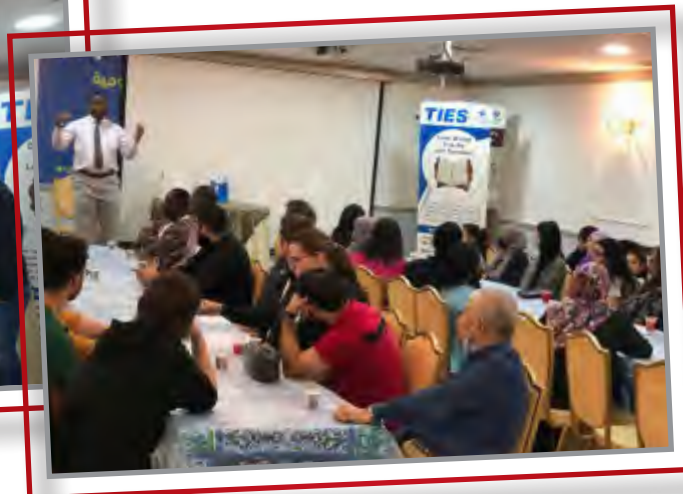
إفطار صائم - داخل الكويت