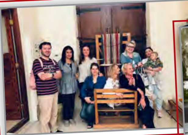
زيارة بيت السدو