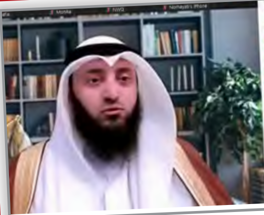
محاضرات على زوم