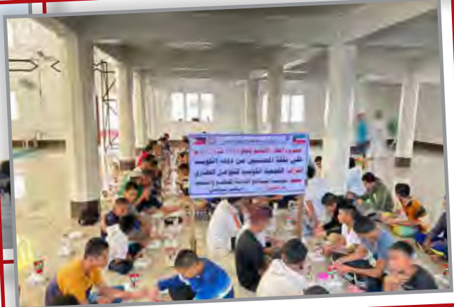
إفطار صائم - خارج الكويت