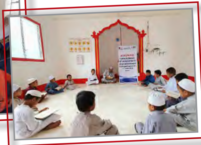
كفالة (محفظ - إمام - مؤذن)